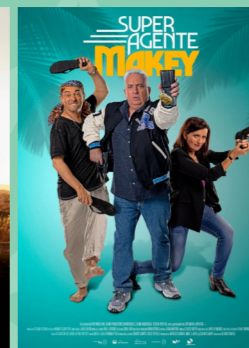
Super agente Makey