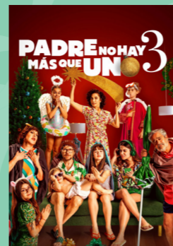
Padre no hay más que uno 3