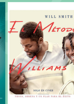
El método Williams