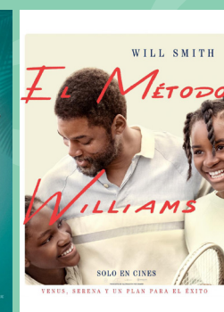
El método Williams