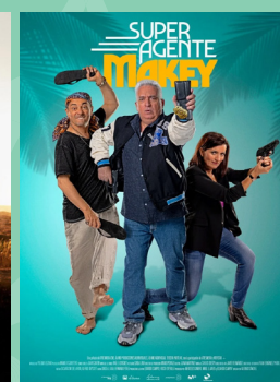
Super agente Makey