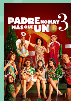
Padre no hay más que uno 3