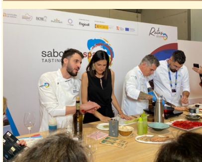
Los cocineros de la asociación Vinaròs Gastronòmic en Madrid Fusión.