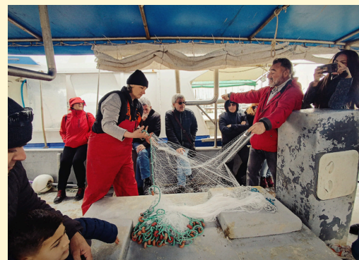
Fotografía de la visita guiada donde los pescadores explican sus técnicas de pesca.